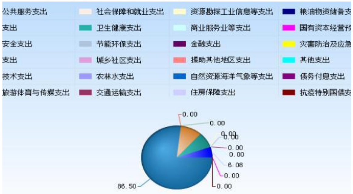
图 2：财政拨款支出决算结构(按功能分类)